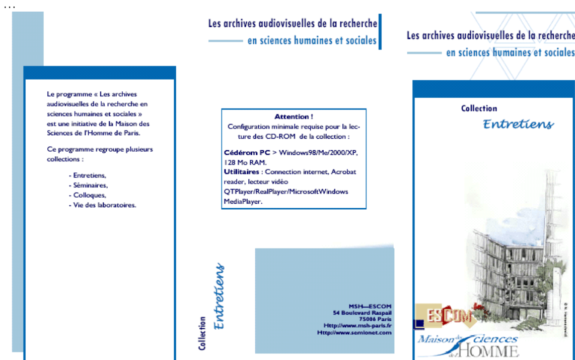
(figure 8 : pages extérieurs du catalogue de la collection « Entretiens »)

Ci-après encore deux figures (figure 8 et 9) représentant deux vues différentes du catalogue de la collection « Entretiens » disponible à l'ESCOM et diffusé sur demande seulement