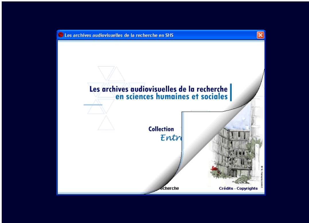
(figure 2 : la fin du générique animé d'un CDROM de la collection « Entretiens »)