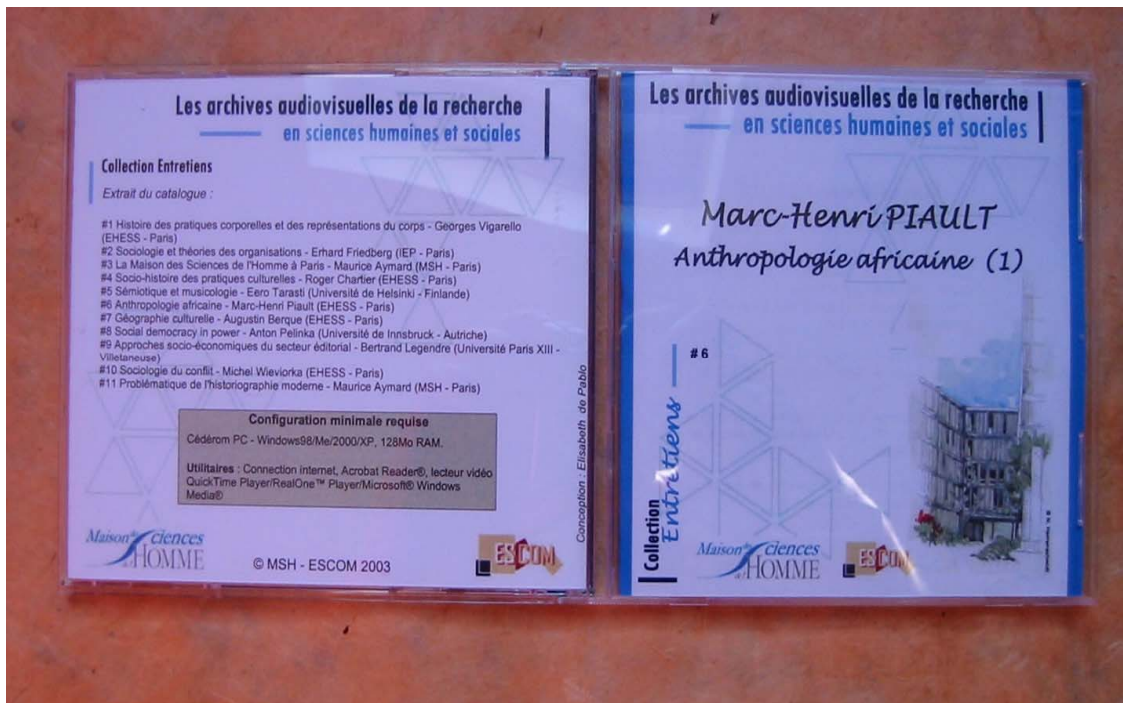
(figure 6 : l'extérieur d'un CDROM de la collection « Entretien »)