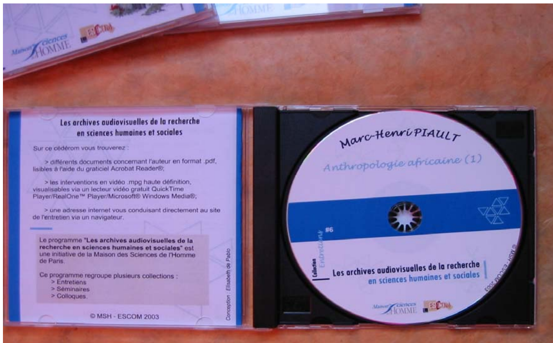
(figure 7 : l'intérieur d'un CDROM de la collection « Entretien »)

Ci-après encore deux figures (figure 8 et 9) représentant deux vues différentes du catalogue de la collection « Entretiens » disponible à l'ESCOM et diffusé sur demande seulement