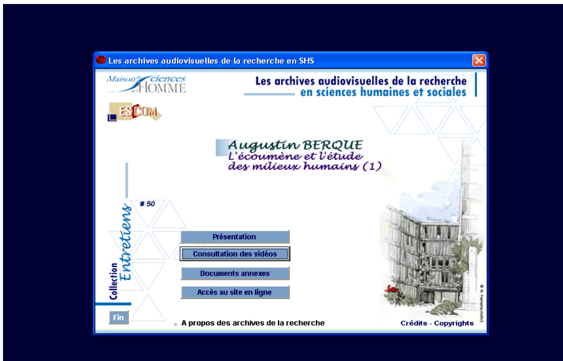
(figure 3 : la page « menu » d'un CDROM de la collection « Entretiens »)