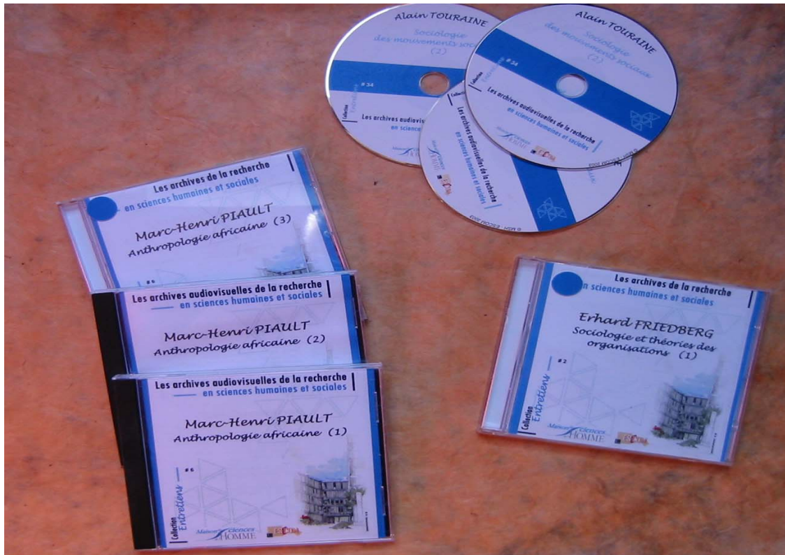
(figure 5 : échantillon de CDROM de la collection « Entretiens »)