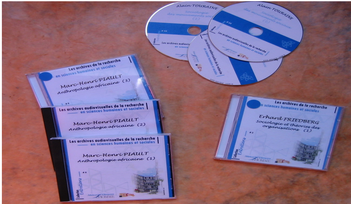
(figure 1 : échantillon de CDROM de la collection « Entretiens »)

Pour le moment, seule la collection « Entretiens » est complètement opérationnelle qui comporte environ 50 titres.