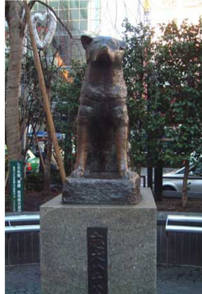
Quartier de Shibuya