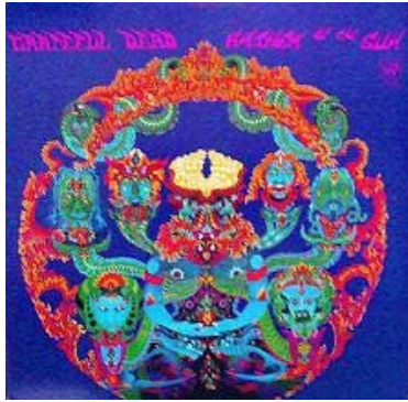
The Grateful Dead « Anthem to the sun »